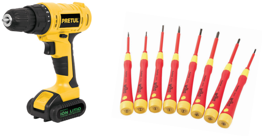
Figura 1.4. Ahora también existen atornilladores / destornilladores eléctricos, aunque los manuales son perfectos para esta actividad. Se venden sueltos o también en kits.